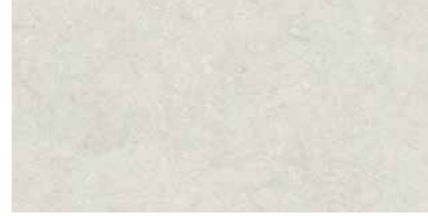
Fossile White / Beyaz