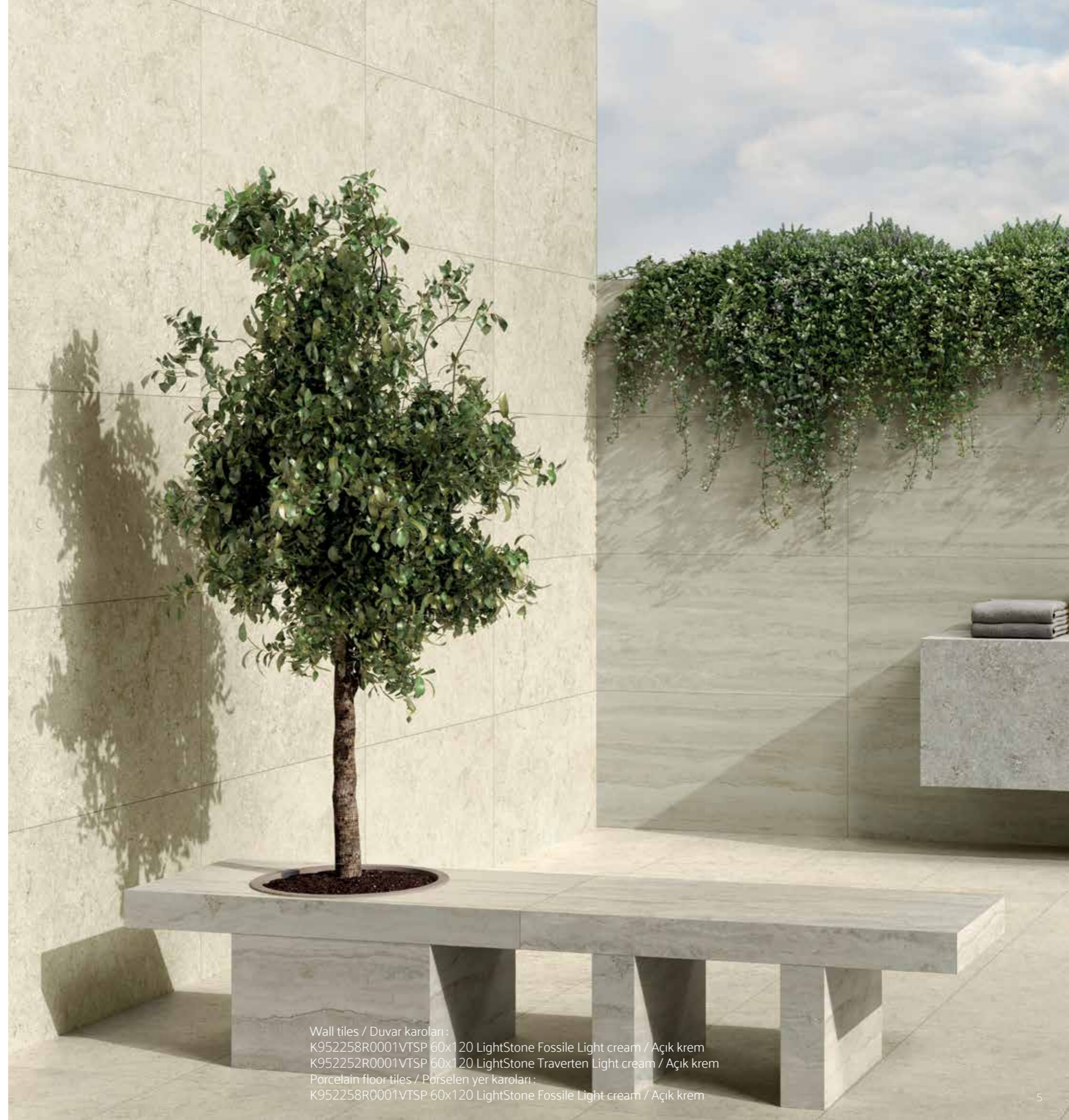
Wall tiles / Duvar karoları : K952258R0001VTSP 60x120 LightStone Fossile Light cream / Açık krem K952252R0001VTSP 60x120 LightStone Traverten Light cream / Açık krem Porcelain floor tiles / Porselen yer karoları : K952258R0001VTSP 60x120 LightStone Fossile Light cream / Açık krem