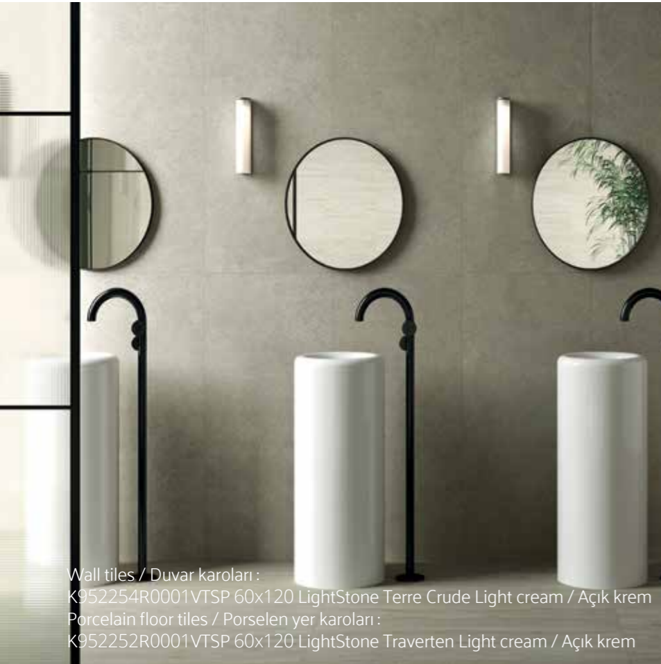
Wall tiles / Duvar karoları : K952254R0001VTSP 60x120 LightStone Terre Crude Light cream / Açık krem Porcelain floor tiles / Porselen yer karoları : K952252R0001VTSP 60x120 LightStone Traverten Light cream / Açık krem

Vitra LightStone Sistemi ile tasarlanmış yaşam alanları, doğa ile insan arasındaki yalın ilişkiyi yansıtarak, rahatlık ve sakinlik duygusu sunuyor. LightStone doğanın dingin ancak dinamik enerjisi ile bağ kuruyor ve rahatlatıcı yaşam alanları yaratılmasına olanak sağlıyor. Vitra Karo'nun yeni Lightstone Sistemi, farklı doğal taş görünümlerini, birbirleriyle uyumlu ve ruhu dinlendiren üç açık renk tonunda bir araya getiriyor. Doğa ile özdeşleşme hissini doğal taş dokularıyla, hijyen arayışını ise açık renk tonlarıyla vurgulayarak yaşam alanlarına rahatlatıcı ve dingin bir atmosfer kazandırıyor.