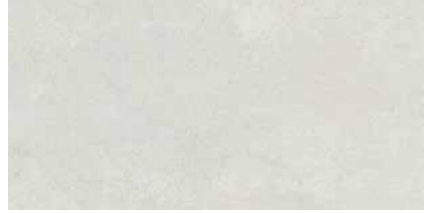
Terre Crude White / Beyaz