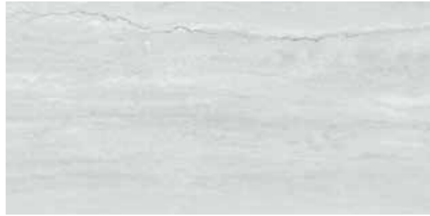
Traverten Light grey / Açık gri