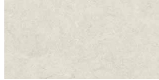
Fossile Light cream / Açık krem