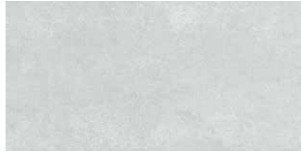
Terre Crude Light grey / Açık gri