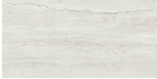
Traverten White / Beyaz