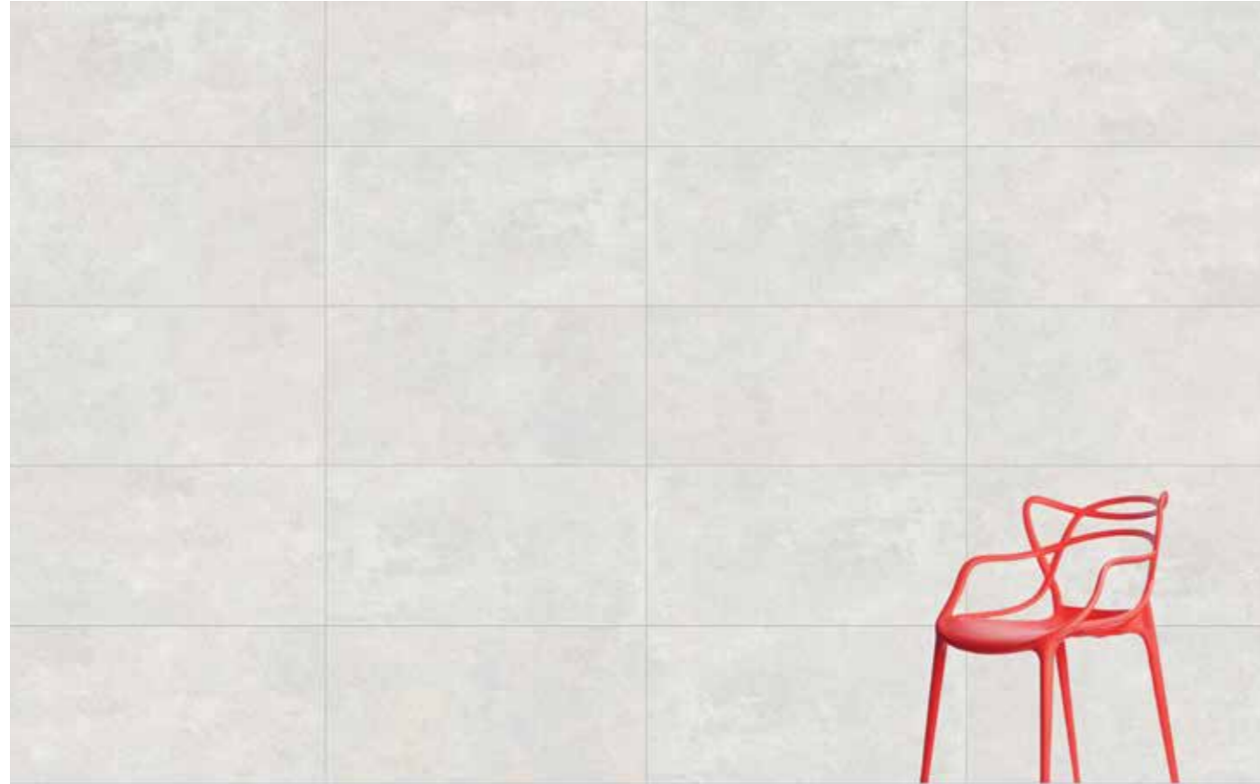
60x120 Terre Crude White / Beyaz 300x120 3 Canvas (10,8 m 2 )