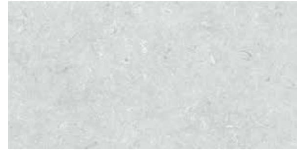
Fossile Light grey / Açık gri