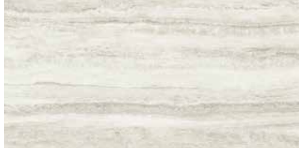
Traverten Light cream / Açık krem