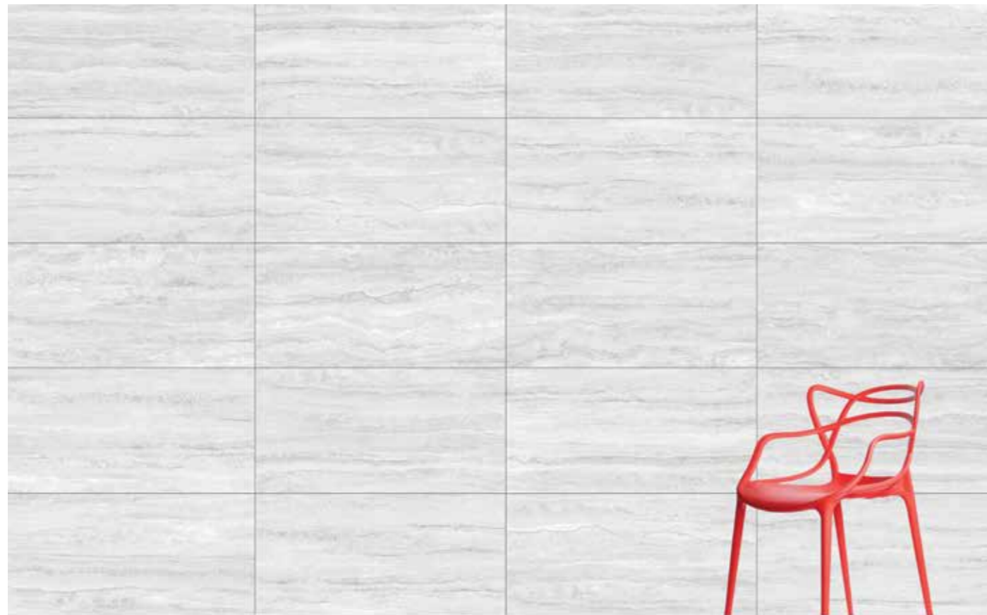
60x120 Traverten Light grey / Açık gri 300x120 3 Canvas (10,8 m 2 )