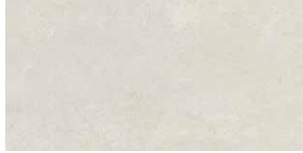
Terre Crude Light cream / Açık krem